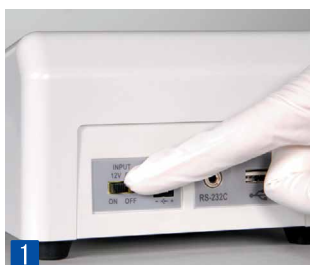
1 Включите переключатель на задней панели