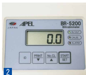
2 Прибор готов к измерению