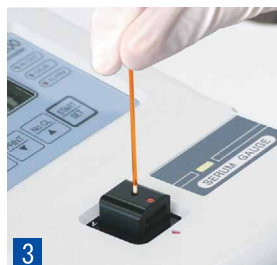
3 Вставьте капилляр (содержащий образец) в держатель