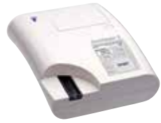
DocUReader 2 Pro

Гибридная станция анализа мочи — биохимический анализатор мочи + анализатор осадка UriSed