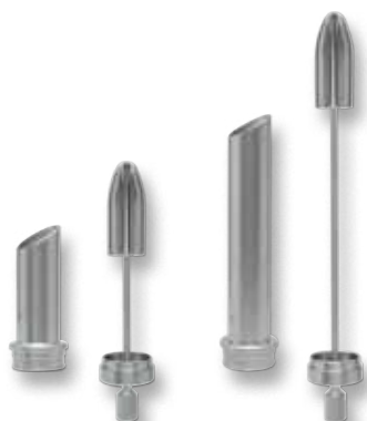
60x22 мм 120x22 мм

Аноскоп/проктоскоп с проксимальным освещением.