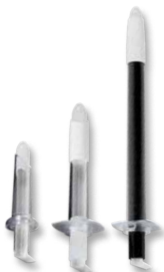
85x20 мм 130x20 мм 250x20 мм