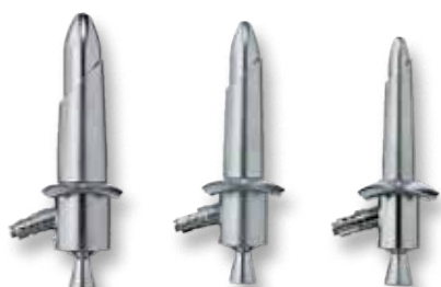
70x25 мм 70x20 мм 70x15 мм