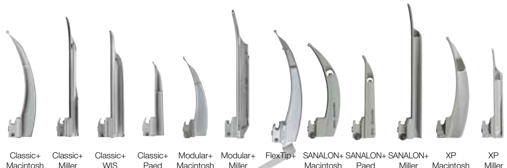
Classic+ Macintosh Classic+ Miller Classic+ WIS Classic+ Paed Modular+ Macintosh Modular+ Miller FlexTip+ Macintosh SANALON+ Macintosh SANALON+ Paed SANALON+ Miller XP Macintosh XP Miller